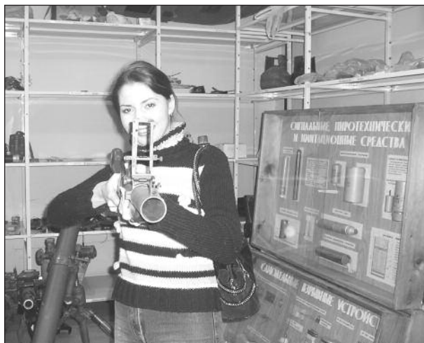
Практика по криминалистике на Петровке-38

Прохождение учебной и профессиональной практики в Экспертно-криминалистическом центре при ГУВД г. Москвы и в отделениях Федеральной